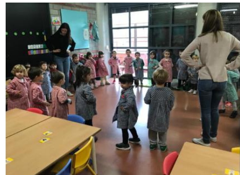
Aquí es veuen els nens de P3 practicant el ball a la classe

una fulla cada parella de 4 i de P4 i les van anar posen 4t A va fer el 0 i 4t B el 5.Tots els nen i nenes s'ho van passar molt bé i els hi va quedar molt bé.