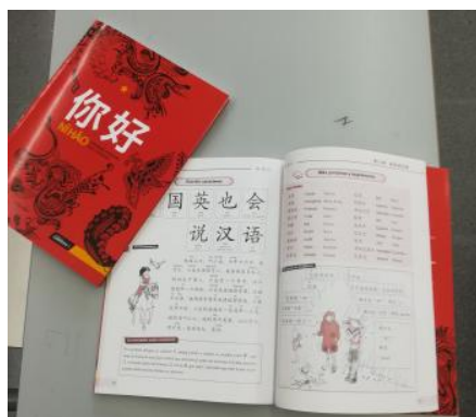
Libres de Xinès

A mi em sembla be que fem aquest tipus de coses perquè es mes divertit que estar prenent apunts tota la hora i després fer un examen. També prenem mes atenció a un alumne que a un professor.